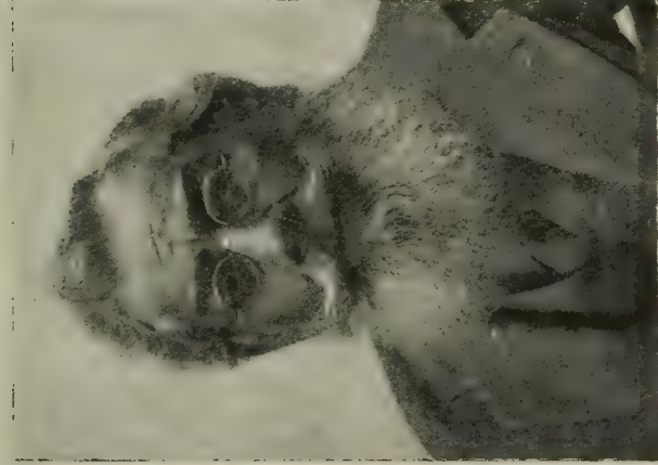
डॉ. बा. शि. मंजे